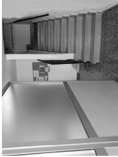
Carrer la Rapa 10